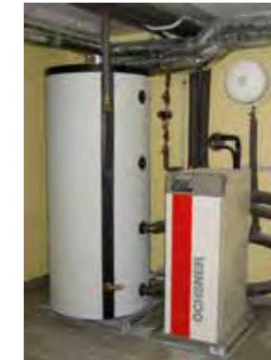
Pompe à chaleur

Les aides financières pour le recours aux énergies renouvelables dans le domaine du logement se rapportent aux coûts d'investissement de l'installation respective et sont limitées à un montant maximal. Ces subventions s'appliquent aussi bien aux projets de rénovation qu'aux nouvelles constructions et peuvent également être sollicitées indépendamment d'un tel projet.