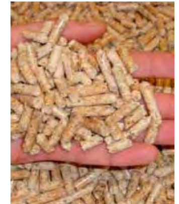
Granulés de bois